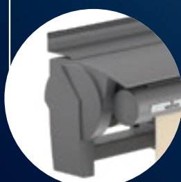
Wandanschluss mit Abdeckprofil (Option)