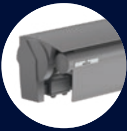
Topas II mit Metallvolant (Option)