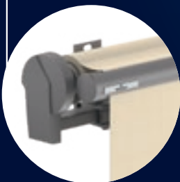
Topas II ohne Dach