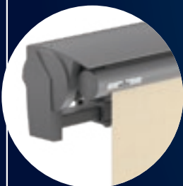
Topas II mit Dach